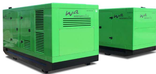
WA-D 500 Ausführung „S“ Schallgedämmtes Aggregat mit manueller Schaltanlage