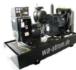
WA – D 250 Ausführung „G“ Grundrahmenaggregat mit manueller Schaltanlage & optionaler Ölauffangwanne

Die Kriterien für unsere Stromaggregate in diesen klassischen Einsatzkategorien sind sehr hoch: Hohe spezifische Leistungen bei gleichzeitig langen Wartungsintervallen, Dauerbetriebsfestigkeit auch bei häufigen Lastwechseln sowie eine hohe Startzuverlässigkeit, um nur einige Beispiele zu nennen.