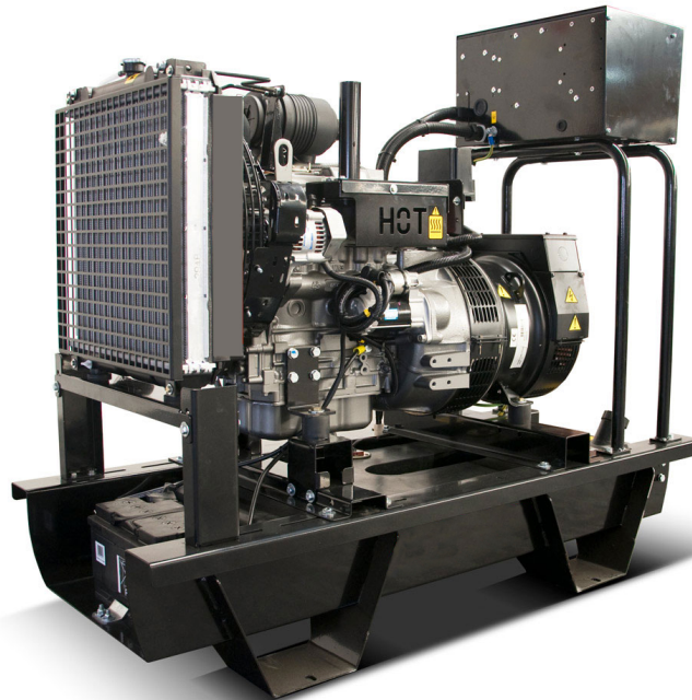
-Abb: WA Y 17 „G“